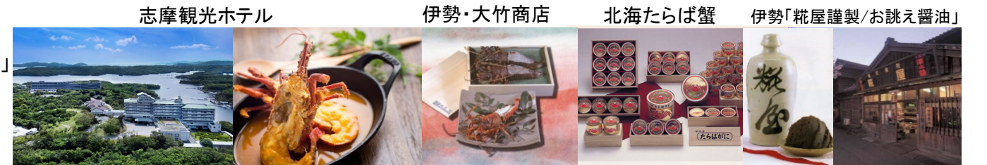
志摩観光ホテル 伊勢・大竹商店 北海たらば蟹 伊勢「靴屋謹製/お誂え醤油」 広島・尾道「しまなみドルチェ ジェラート」 広島・尾道「万汐農園 プリン」 キャビア 篠山農協 旭ポン酢 ヘルメスソース